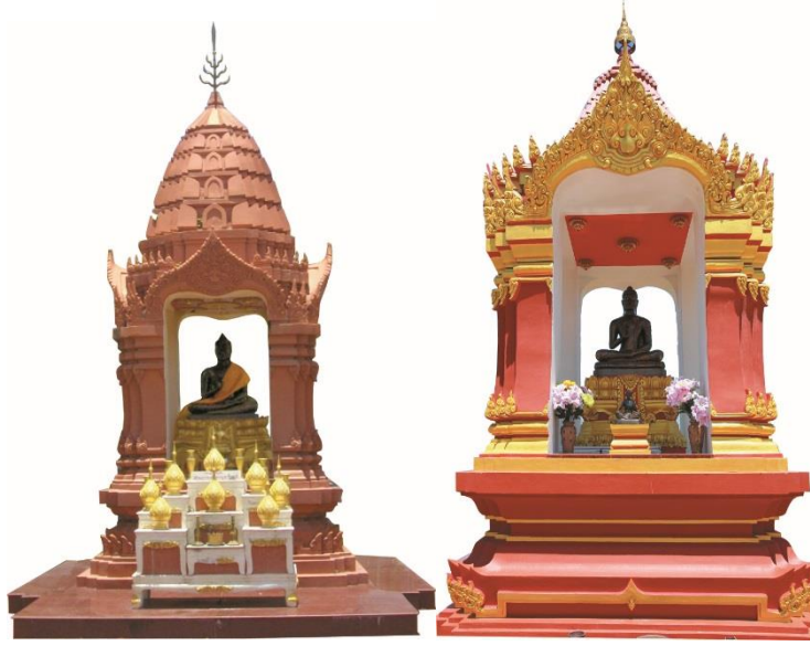
พระพุทธรูปสัมฤทธิ์ บรมครูประชาชนาก สังฆราชอุทิศ ประดิษฐาน ณ มหาวิทยาลัยราชภัฏนครสวรรค์