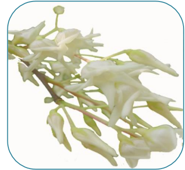
ดอกพะยอม

พะยอมเป็นพรรณไม้ยืนต้นขนาดกลางถึงขนาดใหญ่ สูงประมาณ 15-20 เมตร ทรงพุ่มกลม ผิวเปลือกสีน้ำตาลหรือเทา เนื้อไม้มีสีเหลืองแข็ง ลำต้นแตกเป็นร่องตามยาวมีสะเก็ดหนา ใบเป็นรูปมนรี ปลายใบแหลม โคนใบสอบมน ขอบใบเรียบ ด้านหลังใบมีเส้นใบชัด ดอกออกเป็นช่อ ใหญ่ส่วนยอดของต้น ดอกมีกลีบ 3 กลีบ โคนกลีบดอกติดกับก้านดอก มีลักษณะกลม กลีบดอกเรียบโค้งเล็กน้อย มีสีเหลืองอ่อน กลิ่นหอม